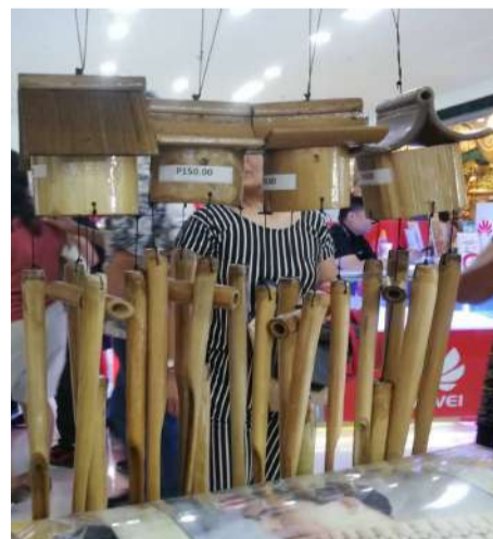
Nakadisplay sa booth ng New Gumaca Wood Craft Multi-Purpose Cooperative ang bamboo wind chime at wild sardines na gawang Atimonan sa pagdaraos ng KALAKAL Quezon noong Disyembre 12-16.

Tampok sa katatapos lamang na KALAKAL Quezon trade fair ang dalawang produkto na wild sardines gawa ng Atimonan Coastal Food Production Association at bamboo wind chimes gawa ng Villa Ibaba Handicraft Association.