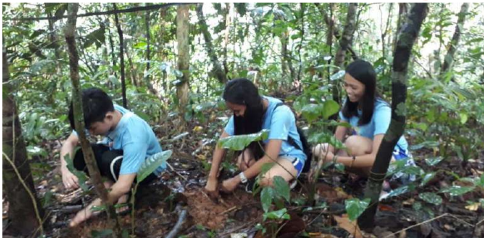
Ilang estudyante mula sa College of Sciences Technology and Communications na nakiisa sa pagtatanim ng mga puno sa Quezon Protected Landscape noong Oktubre 13.

Nakiisa ang Atimonan One Energy, Inc. (A1E) sa dalawang magkasunod na araw ng tree planting activity sa Quezon Protected Landscape (QPL) noong Oktubre 30 at 31 na naglalayong tuluy-tuloy na pangalagaan ang kalikasan.